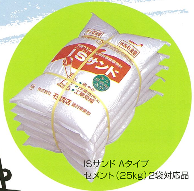
ISサンド Aタイプ セメント(25kg)2袋対応品